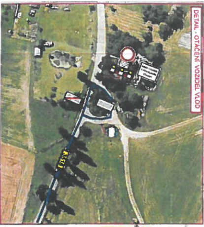
DETAIL - OTÁČENÍ VOZIDEL V ÚOJ

STAVBA, Kamencek, správní budova TERMÍN OMEZENÍ: 1. 8. 2023 - 31. 10. 2023 STAVBY* * Uzavření úseků ul. M02518 v obci Kamencek a Kamencek pro veřejný provoz. JAKO VOZIDEL, S POVOLENKOU Délka uzavřeného úseku ul. M02518 1030 m Délka uzavřeného úseku ul. M0249 1025 m, M02518, M02518, M0252 Délka objízdné trasy 13,2 km ETAPA II.