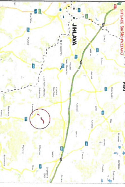
SITUACE ŠIRŠÍCH ZEMĚDĚLSTVÍ

STAVBA, Kamencek, správní budova TERMÍN OMEZENÍ: 1. 8. 2023 - 31. 10. 2023 STAVBY* * Uzavření úseků ul. M02518 v obci Kamencek a Kamencek pro veřejný provoz. JAKO VOZIDEL, S POVOLENKOU Délka uzavřeného úseku ul. M02518 1030 m Délka uzavřeného úseku ul. M0249 1025 m, M02518, M02518, M0252 Délka objízdné trasy 13,2 km ETAPA II.