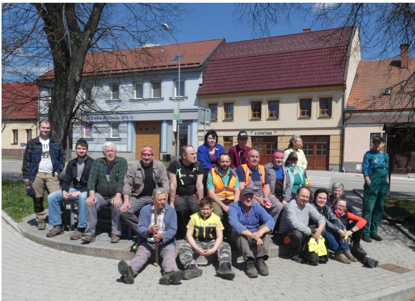
Obr. Dobrovolníci úklidové akce „Za Měřín krásnější“

Všem dobrovolníkům, kteří se úklidu zúčastnili, DĚKUJEME.