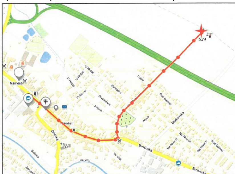
Obrázek 3: Měříň. Cesta na měřínské popraviště. Současná mapa převzata z mapy.cz. Upraveno

Samotná cesta na popraviště mohla vypadat následovně. Odsouzenci byl trest přečten u pranýře, který stával na rohu radnice – v dnešní době zde, jak už bylo zmíněno, stojí hotel KLAS. Poté by se průvod vydal přes náměstí a dál kolem kaple Panny Marie Sněžné. Ta zde byla vystavena v raném baroku, v roce 1690 (Památkový katalog 2015c [online]). Následně by cesta pokračovala ulicí Za Hřbitovem vzhůru k popravišti. Trasa by za takovýchto podmínek měřila zhruba 1,2 km, pro její zdolání by člověk potřeboval cca 20 minut a celkové převýšení by činilo 37 metrů. Popraviště bylo situované v nadmořské výšce 523 metrů.