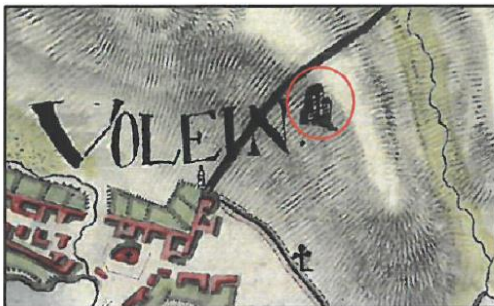
Obrázek 1: Měřín. Místo bývalého popraviště. 1.VM převzato z mapire.eu , First Military Survey, Markgrafschaft Mähren (1764-1768). Upraveno

Místo bývalého popraviště je dohledatelné i na mapě z Prvního vojenského mapování. Černě provedená značka je umístěna jihovýchodně od města. Zajímavostí je, že zde můžeme spatřit vyobrazená ona dvě kola na lámání.