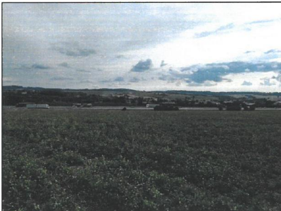
Obrázek 2: Měříň. Pohled z místa, kde stávalo popraviště, směrem na Měříň.

Samotná cesta na popraviště mohla vypadat následovně. Odsouzenci byl trest přečten u pranýře, který stával na rohu radnice – v dnešní době zde, jak už bylo zmíněno, stojí hotel KLAS. Poté by se průvod vydal přes náměstí a dál kolem kaple Panny Marie Sněžné. Ta zde byla vystavena v raném baroku, v roce 1690 (Památkový katalog 2015c [online]). Následně by cesta pokračovala ulicí Za Hřbitovem vzhůru k popravišti. Trasa by za takovýchto podmínek měřila zhruba 1,2 km, pro její zdolání by člověk potřeboval cca 20 minut a celkové převýšení by činilo 37 metrů. Popraviště bylo situované v nadmořské výšce 523 metrů.