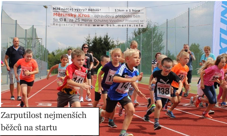
Zarputilost nejmenších běžců na startu