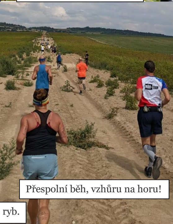
Přespolní běh, vzhůru na horu!