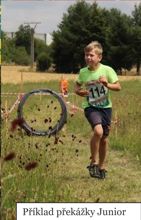
Příklad překážky Junior