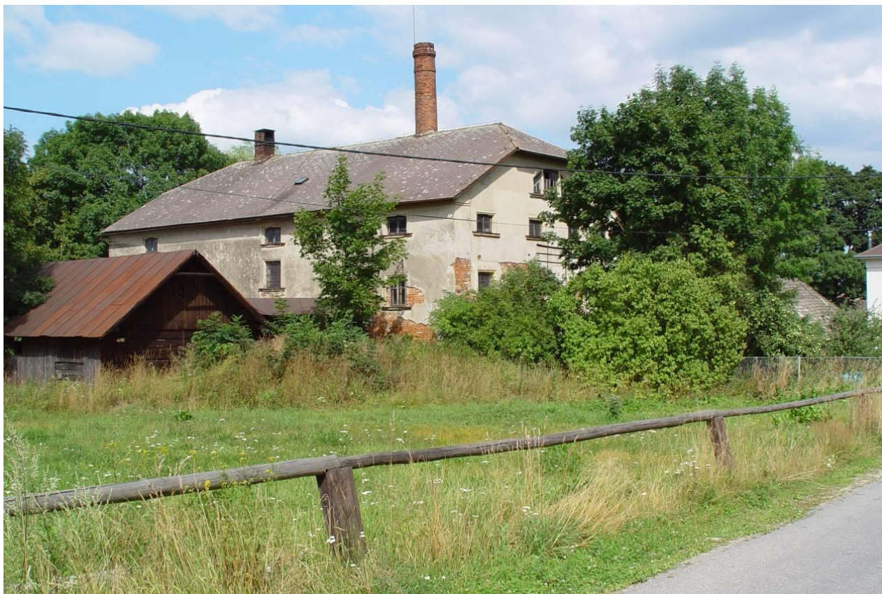
Vodičkův mlýn č. 76 s továrním komínem vyfocen koncem 20. století.