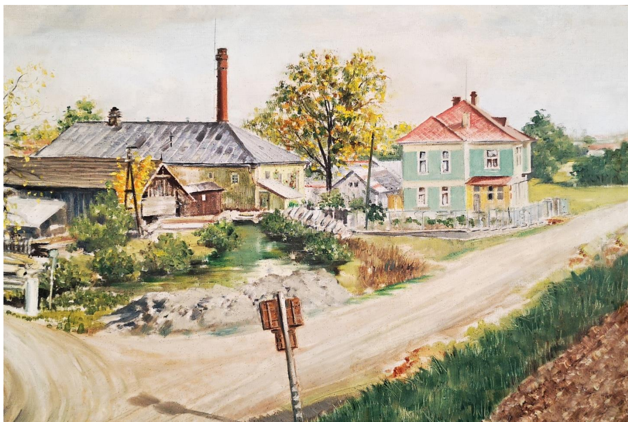
Obraz Vodičkova mlýna před jeho vyhořením v r. 1936 namaloval v r. 1934 malíř Veselý. V té době byl mlýn ještě o jedno poschodí nižší. K budově mlýna byla přistavěna pekárna.