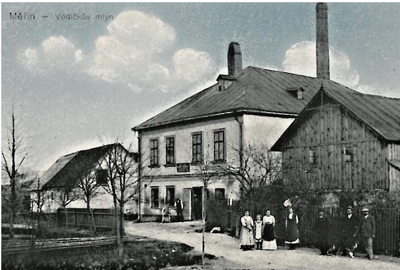
Fotografie zachycuje Vodičkův mlýn na začátku 20. století. Mlýn ale v roce 1936 vyhořel. Při jeho opravě bylo mlýnu přistavěno ještě jedno poschodí.