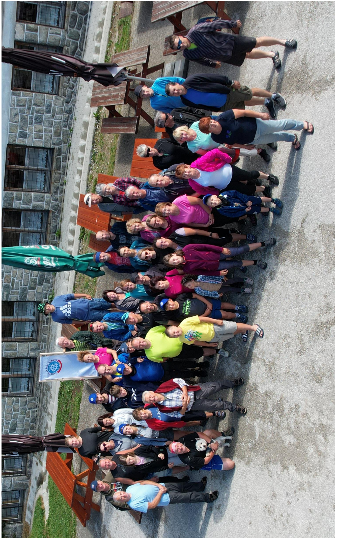
Obr. Letní zájezd – Martinské hole, společné foto