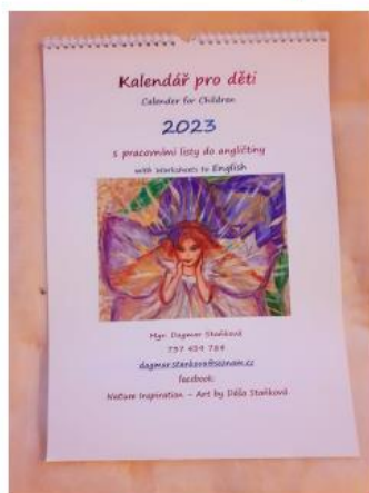
Obrázek 1 Kalendář pro děti

k dostání v papírnictví Měřín u p. Wasserbauerové