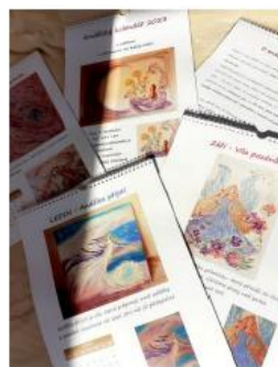
Obrázek 2 Andělský kalendář