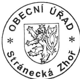
Antžonín Račický starosta

Odvolání proti tomuto rozhodnutí podle § 24 odst. 4 zákona č. 13/1997 Sb. nemá odkladný účinek. Proti vyloučení odkladného účinku se nelze odvolat (§85 odst. 4 zákona č. 500/2004)