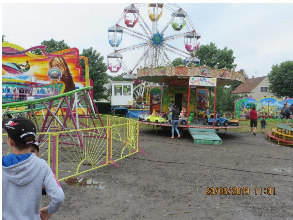
Měřínská pouť 2019